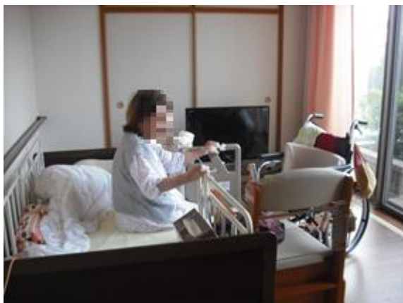
シミュレーション室一泊訓練