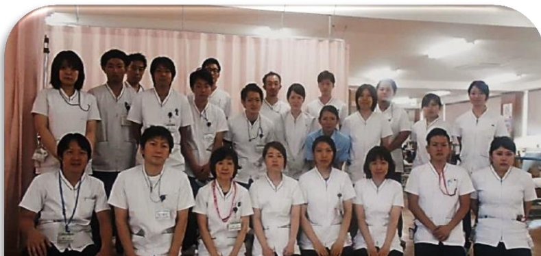
リハビリテーション室スタッフ