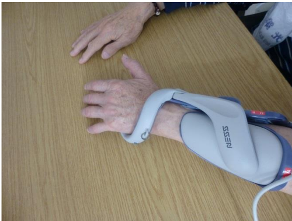
電気刺激を使用しての訓練