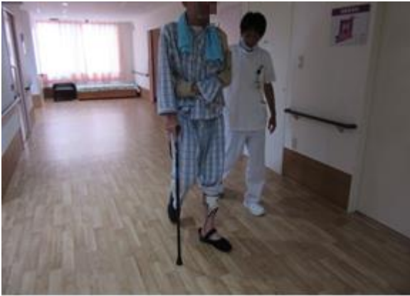
装具を使用しての病棟廊下での歩行訓練

当院では、早期から治療用装具を装着しての起立・歩行訓練を積極的に実施、また電気刺激機器を利用したの機能回復訓練も併用して実施し、機能向上に繋げています。回復期リハビリ病棟では、平均7単位のリハビリを365日提供し、在宅復帰率は93%（H28年5月現在）となっており、病院建て替えとともに新設されたシミュレーション室を使用し、より在宅退院を見据えた訓練を実施しております。