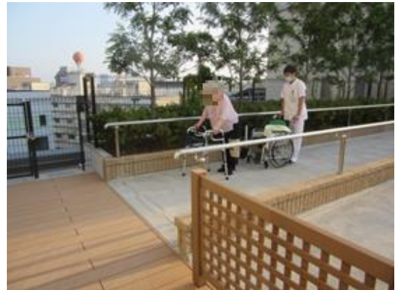
屋上庭園歩行訓練